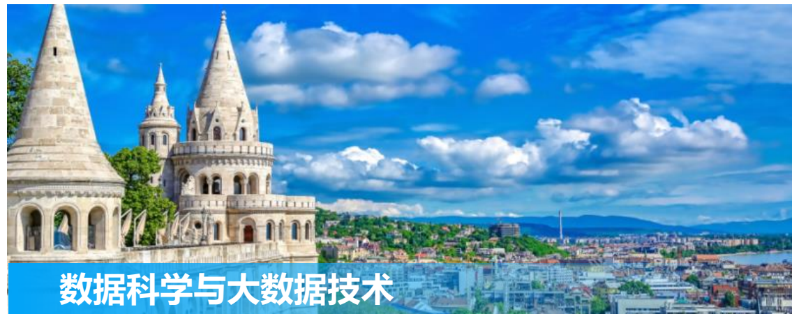
数据科学与大数据技术