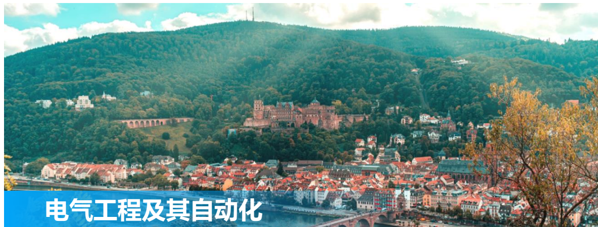
电气工程及其自动化